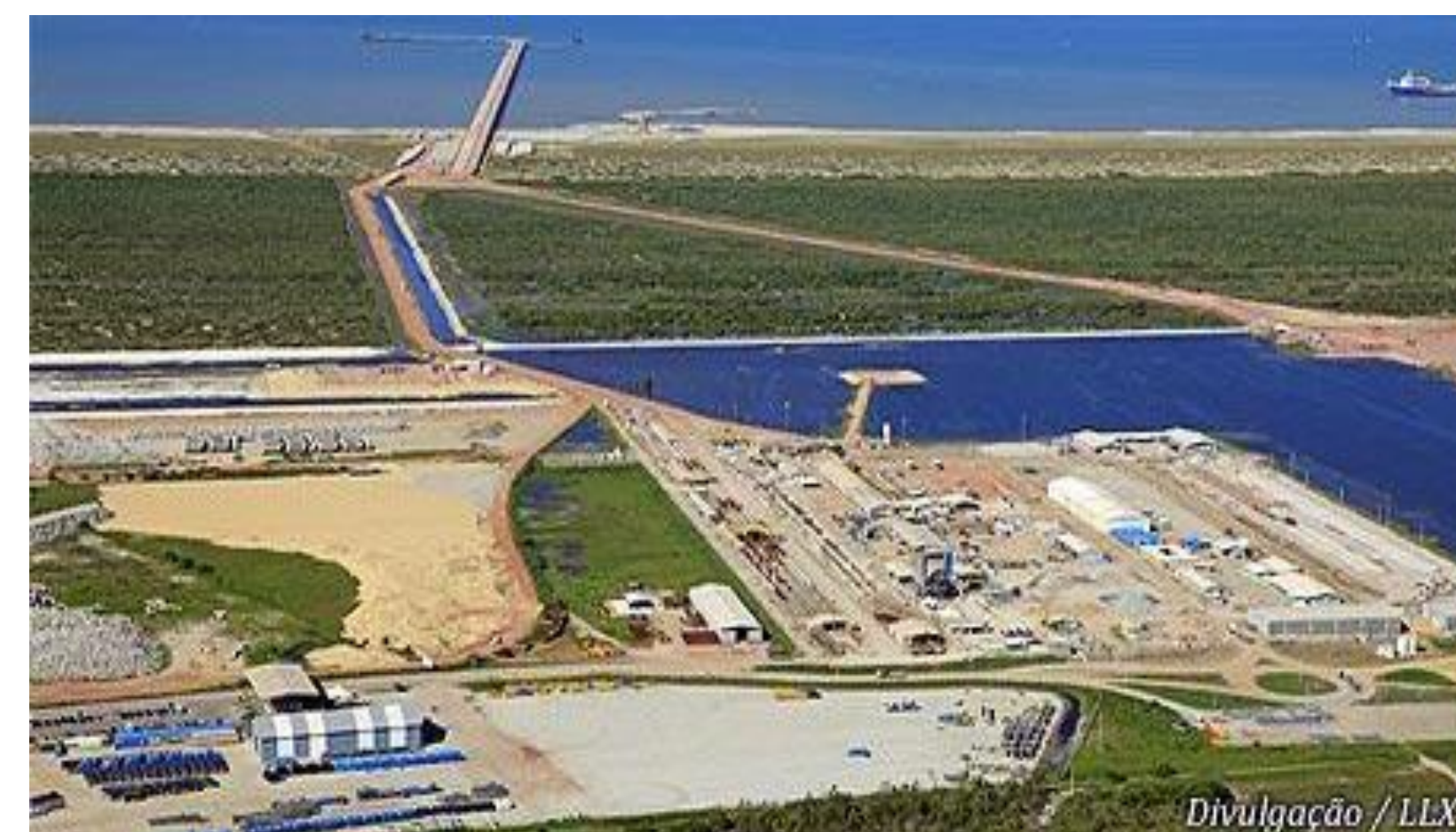
Figura 3 – Complexo Portuário do Açú.