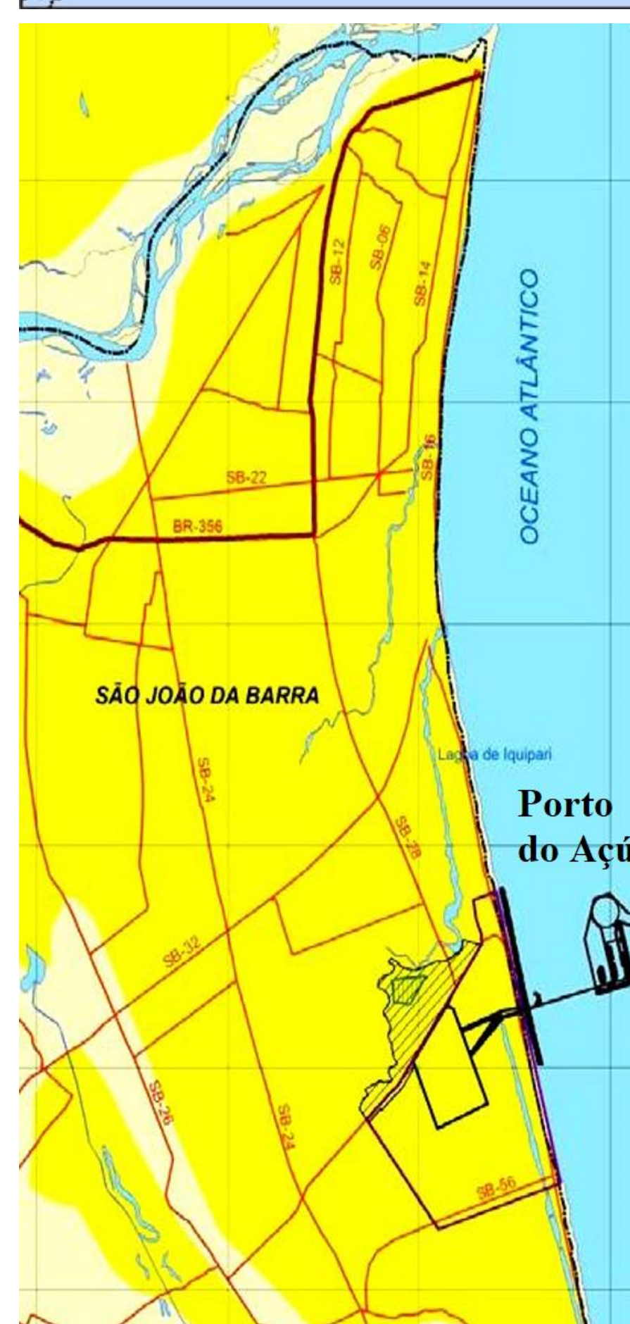
Figura 2 – Mapa de localização do Complexo Portuário do Açú.